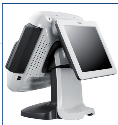
Segunda Pantalla de 12.1".