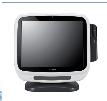
Lector de Banda Magnética.