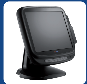
Modelo Color Negro.